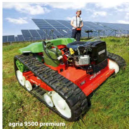
agria 9500 premium

Abgebildete Maschinen können Zubehör enthalten.