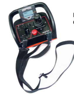
Bequemes und sicheres Steuern der Gerätefunktionen per Fernbedienung