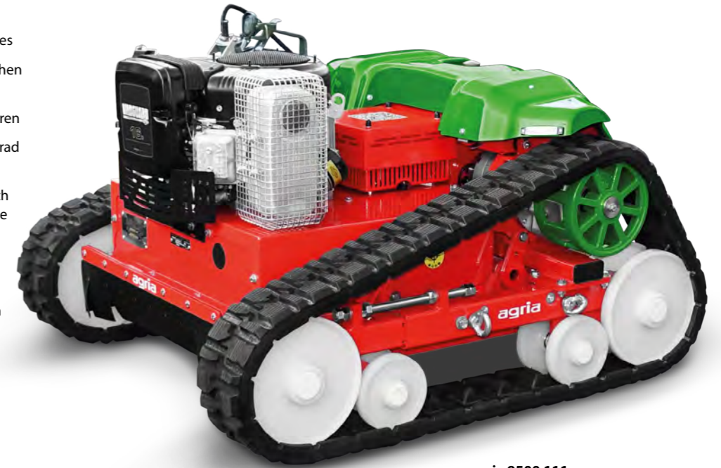
agria 9500 111