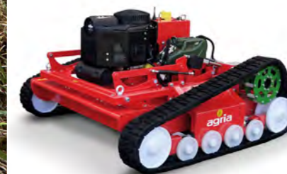
agri a 9600