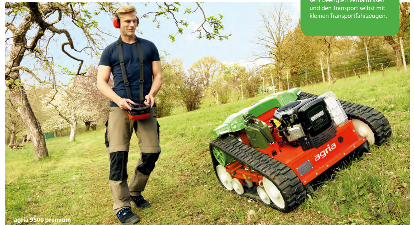
agria 9500 premium

Die kompakte Bauweise erlaubt den Einsatz auch unter sehr beengten Verhältnissen und den Transport selbst mit kleinen Transportfahrzeugen.