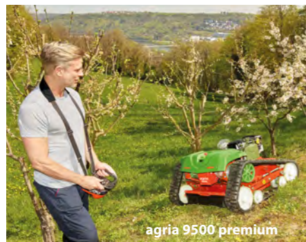
agria 9500 premium