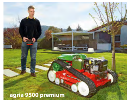
agria 9500 premium