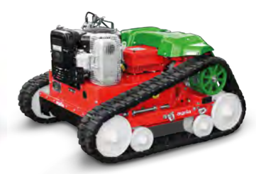
agri a 9500