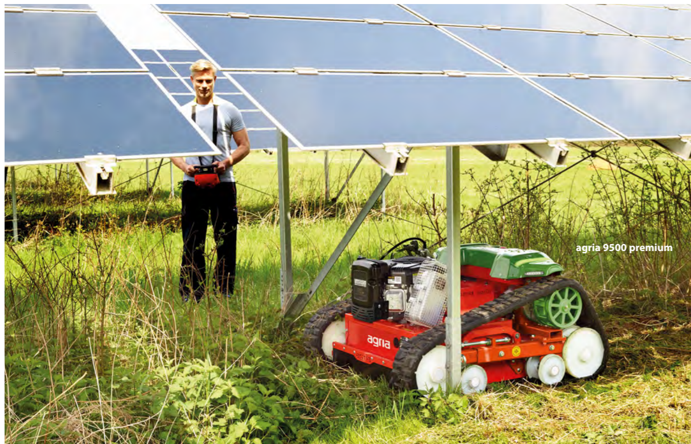
agria 9500 premium